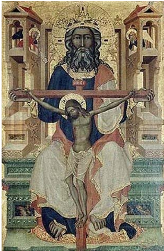
„Gnadenstuhl“ – Darstellung der Trinität ab dem 12. Jh. n. Chr.

Das Leiden an der Unsichtbarkeit und Unerfahrbarkeit Gottes gründet in drei biblischen Voraussetzungen, die angesichts der eigenen und der Geschichtserfahrung im Widerspruch zu stehen scheinen: